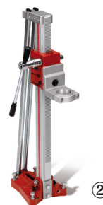
Supporto per fori impegnativi ②