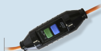
Dispositivo salvavita PRCD 10 mA integrato nel cavo

Per fori manuali dove richiesto è necessario utilizzare il dispositivo di raccolta acqua.