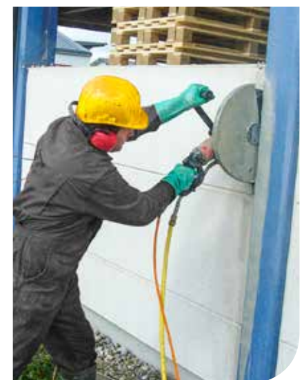
Tagli di pannelli in cls filo putrella

TS 40 Potenza senza confronti nient'altro è paragonabile!