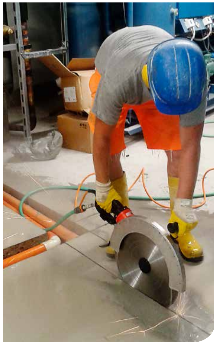
Tagli veloci per canalette in spazi ristretti.