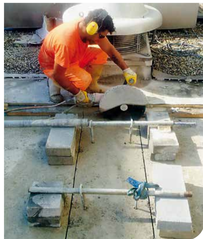
Tecnica di taglio per aperture di lucernai