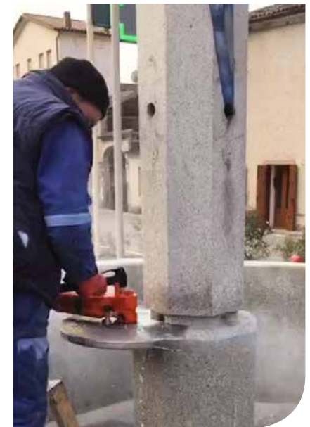
Tagli di pilastri fortemente armati

FU6 U: dopo l'allacciamento al quadro elettrico, collegate TS 40 poi girate l'interruttore in posizione 1, aspettate 30", infine con il Led verde fisso e click, il sistema è pronto.